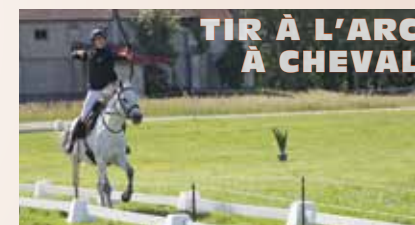
TIR À L'ARC À CHEVAL